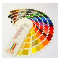
Sonderlackierung - Vormontagerahmen - RAL Classic nach Kundenwunsch