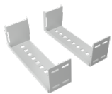
Wandabstandshalter 30 cm (für Dolomit II / Scala II)