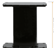
Extender für Aluminiumhubsäulen