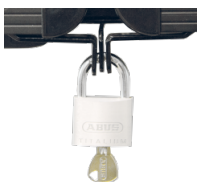
Halterungen und Flügelschloss