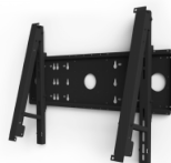
Adapter für HKS LCD Halterung - Surface Hub 2S 85"