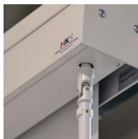
Kurbelantrieb - links