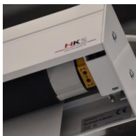
Motorantrieb - links